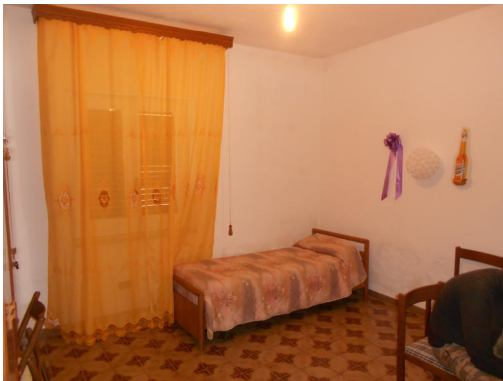
Corpo A - Foto 13