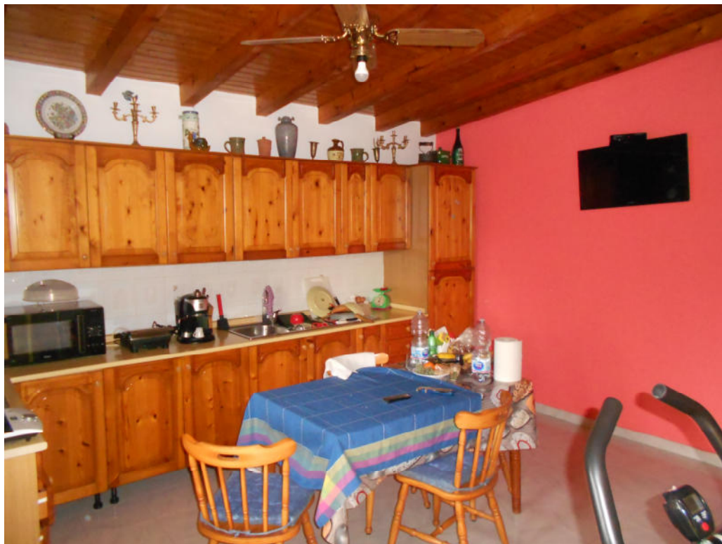
Corpo B - Foto 47