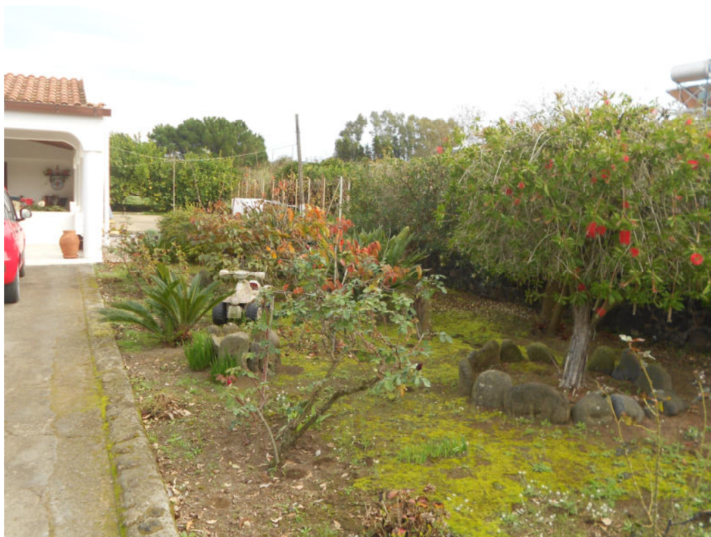
Corpo A - Foto 32