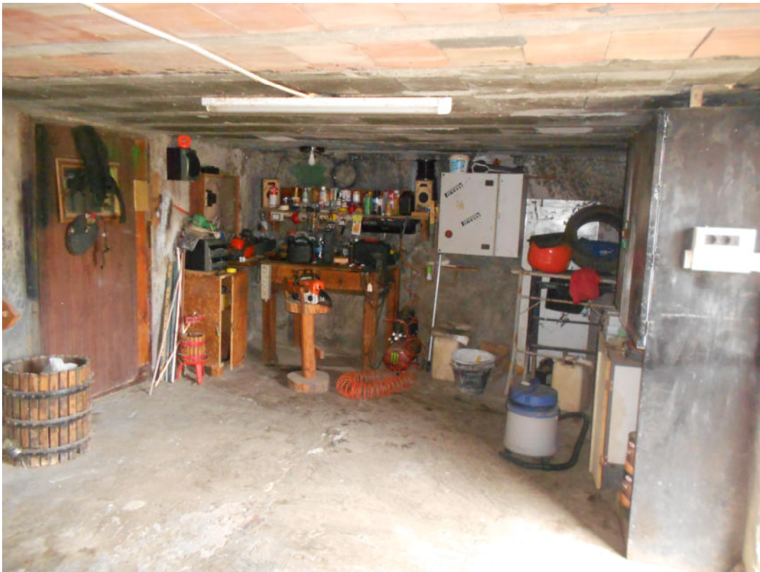
Corpo A - Foto 29