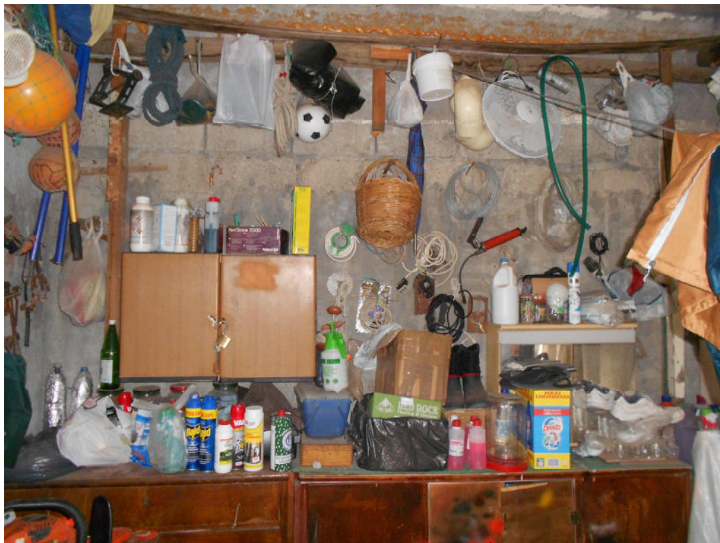
Corpo B - Foto 55