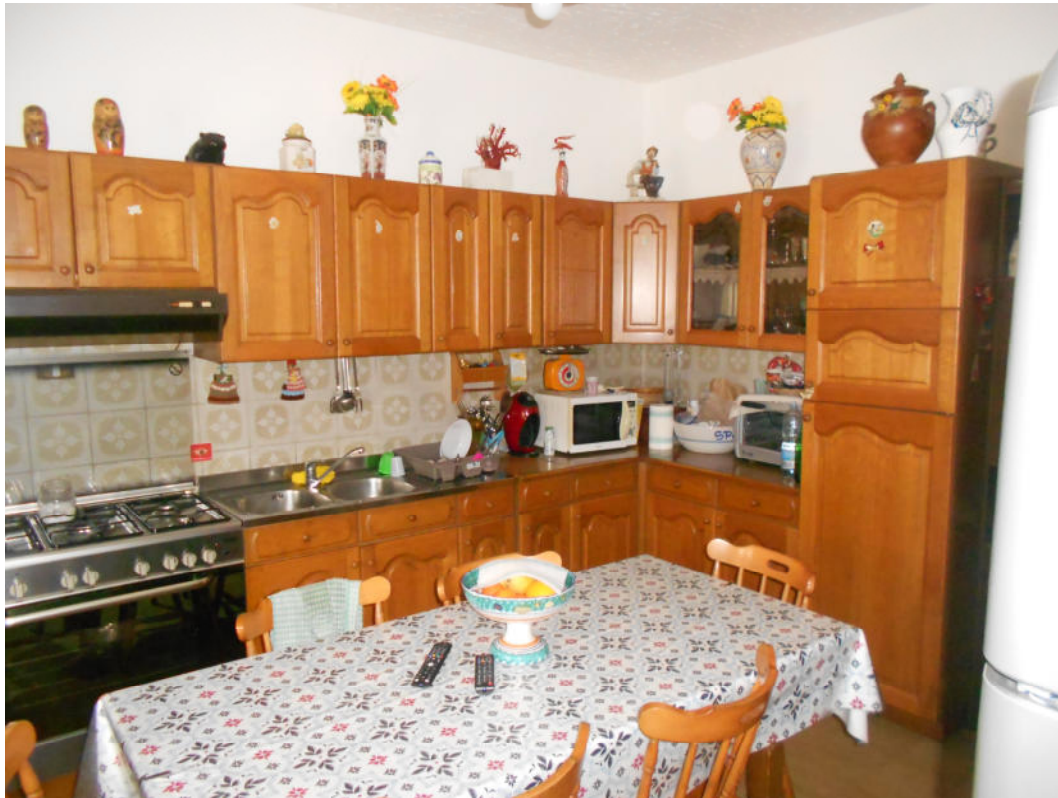
Corpo A - Foto 9