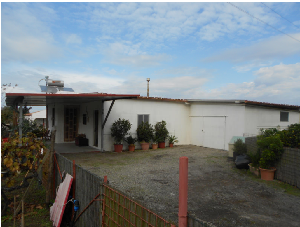
Corpo B - Foto 44