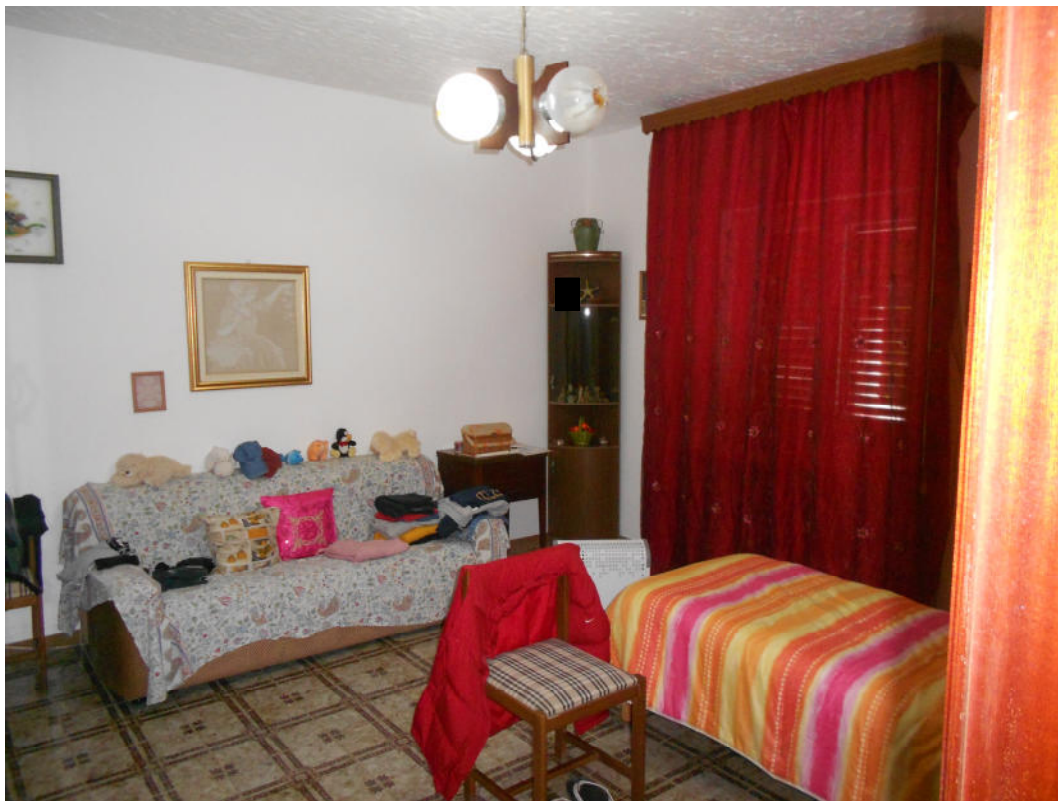
Corpo A - Foto 10