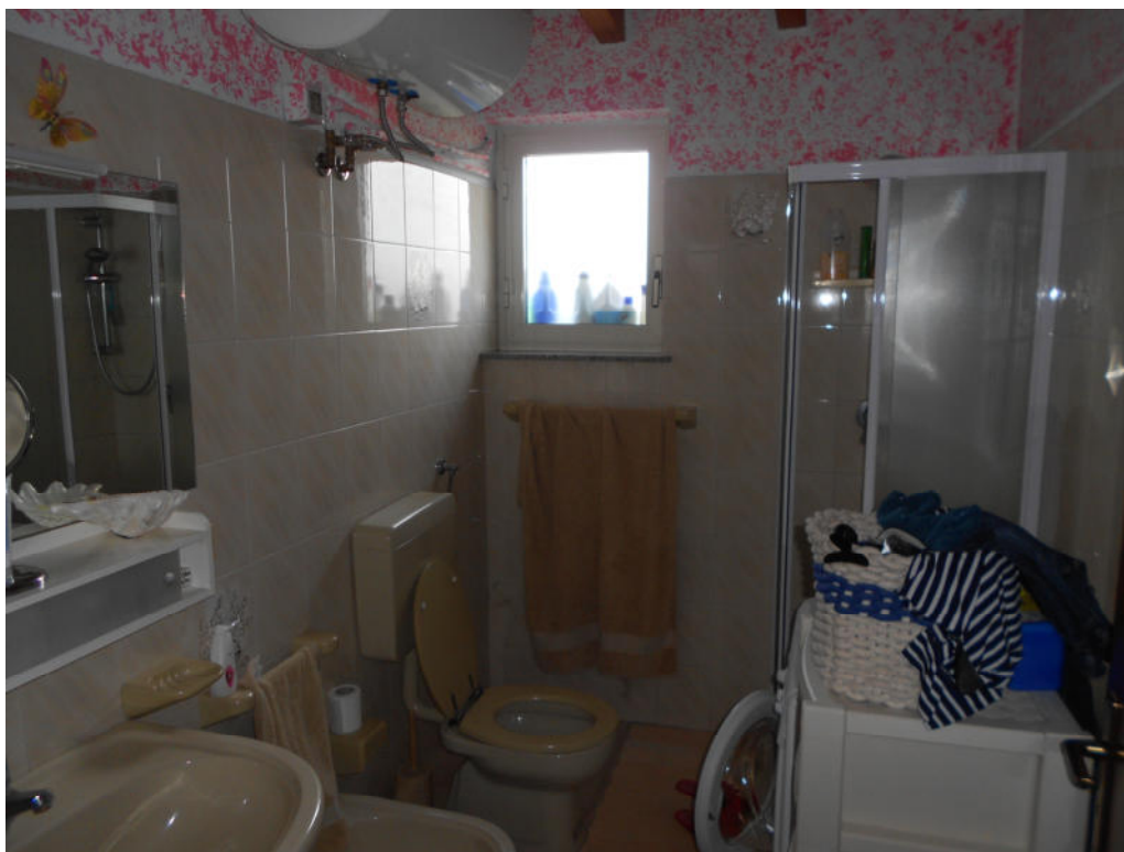
Corpo B - Foto 50