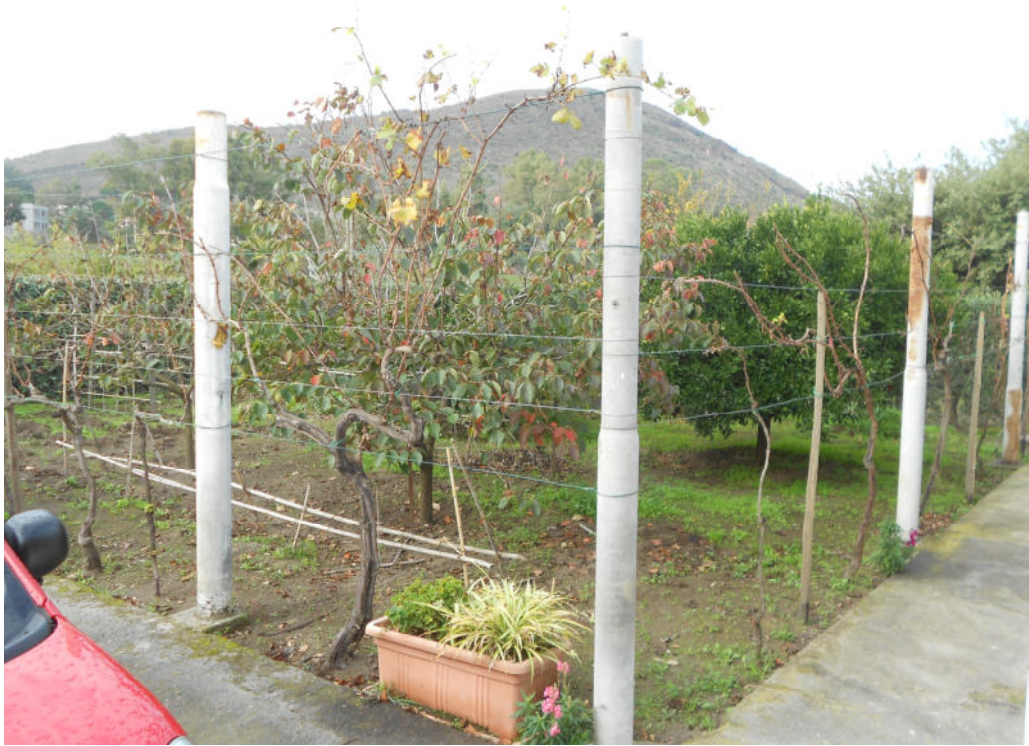
Corpo A - Foto 30