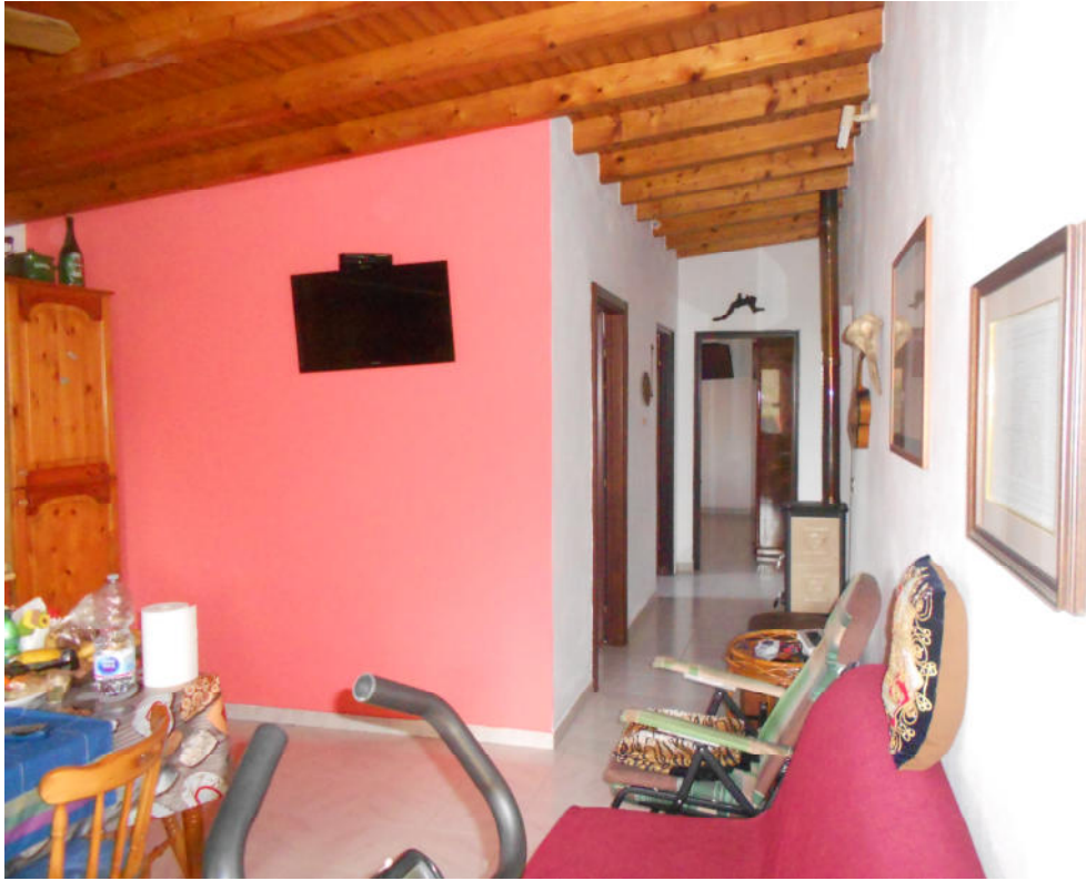
Corpo B - Foto 48