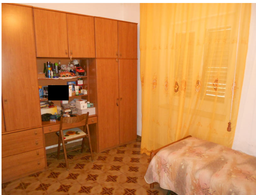
Corpo A - Foto 12