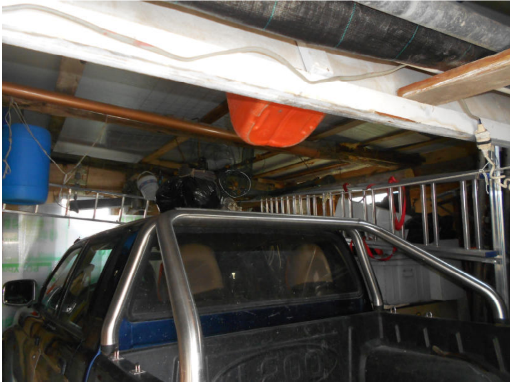
Corpo B - Foto 54