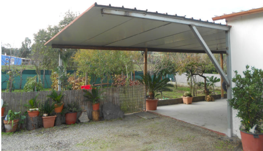
Corpo B - Foto 38