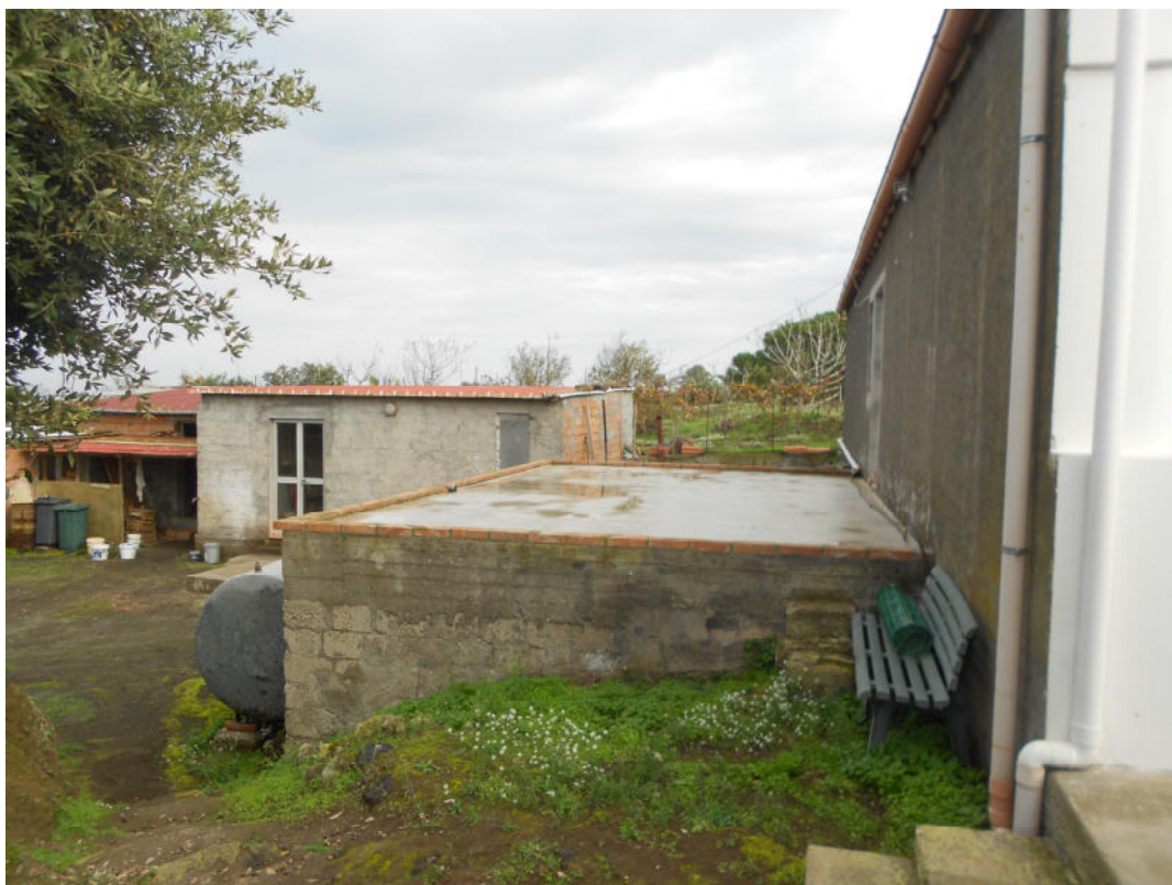
Corpo A - Foto 26