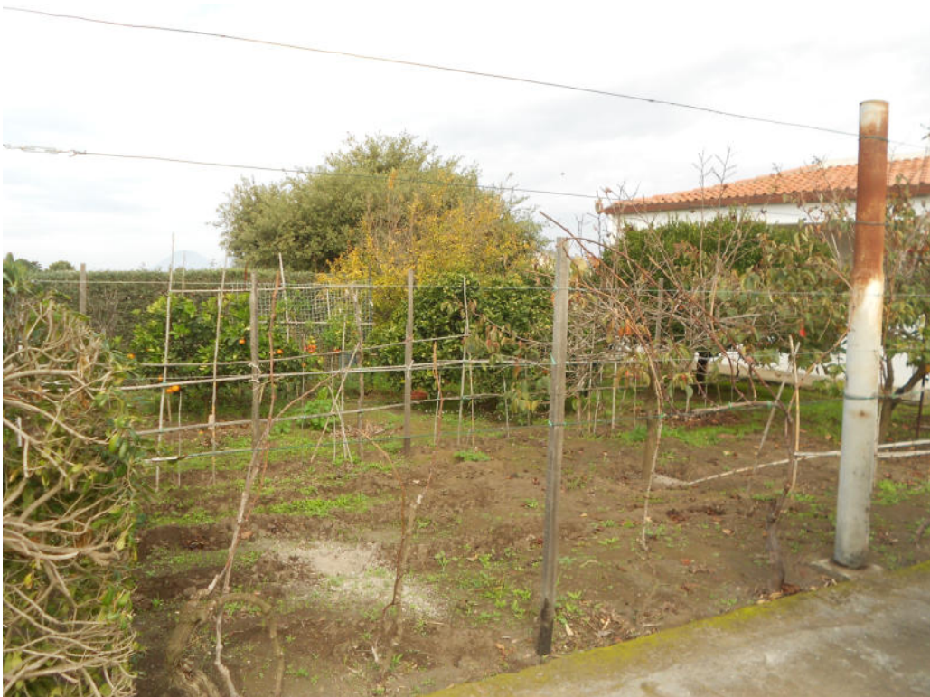
Corpo A - Foto 31