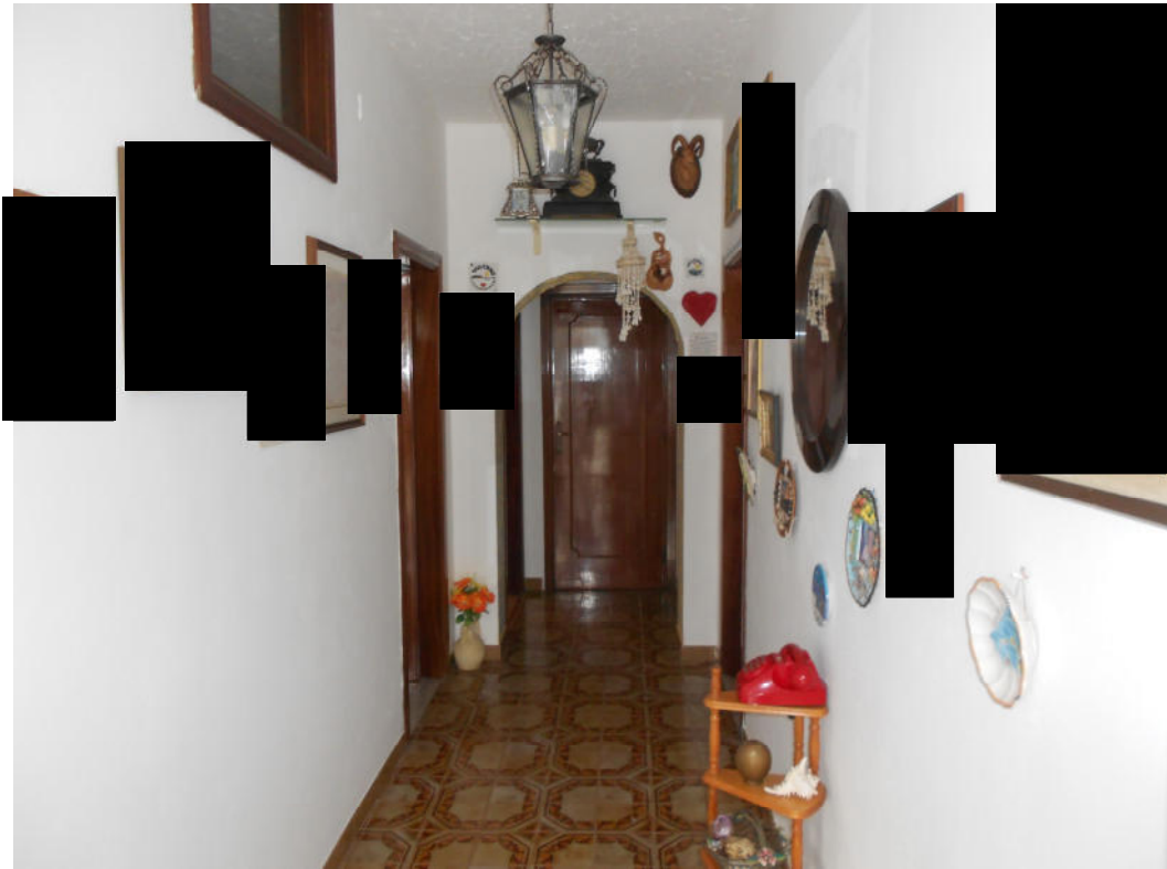
Corpo A - Foto 7