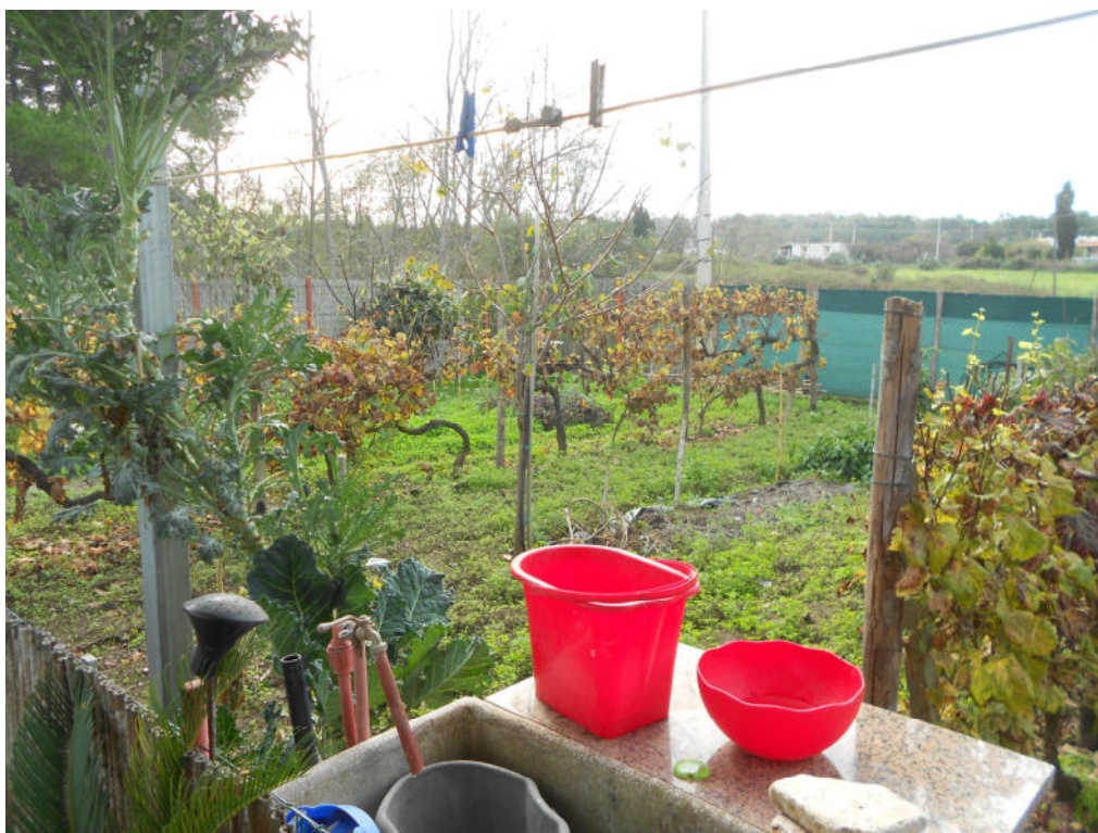
Corpo B - Foto 41