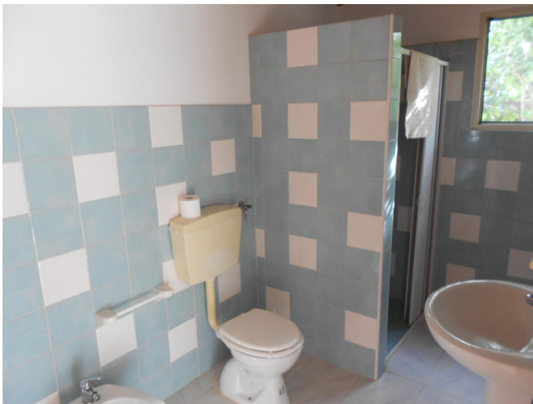
Corpo A - Foto 16