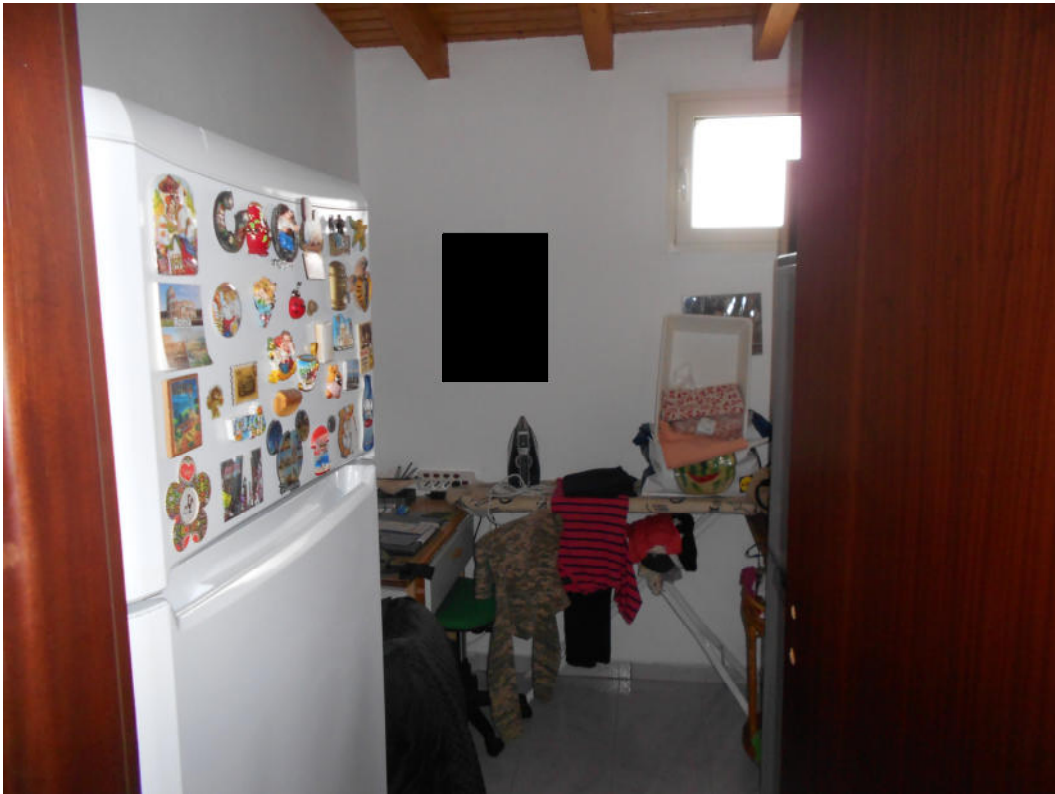
Corpo B - Foto 49