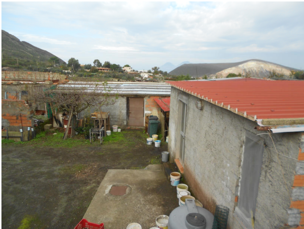
Corpo A - Foto 23