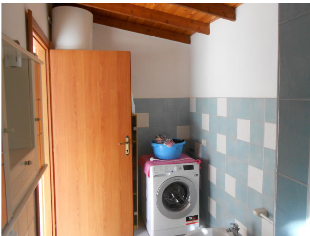
Corpo A - Foto 17