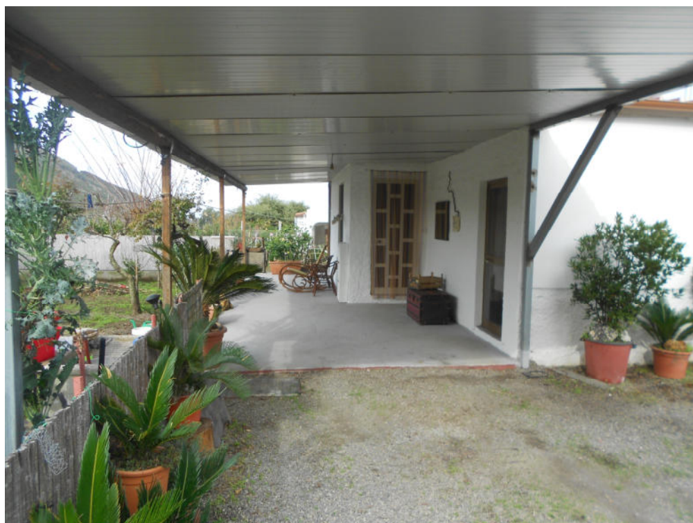
Corpo B - Foto 35