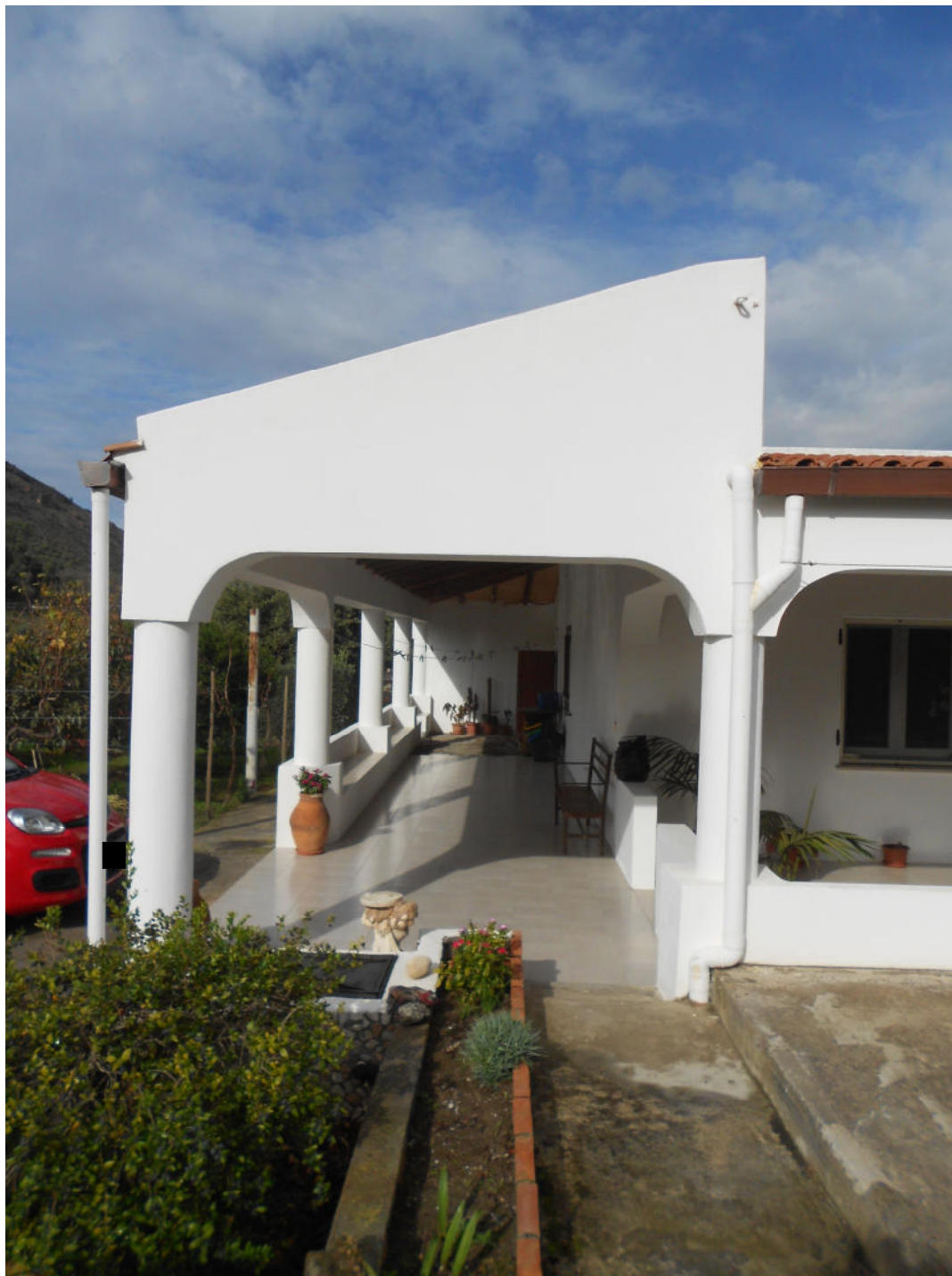
Corpo A - Foto 3