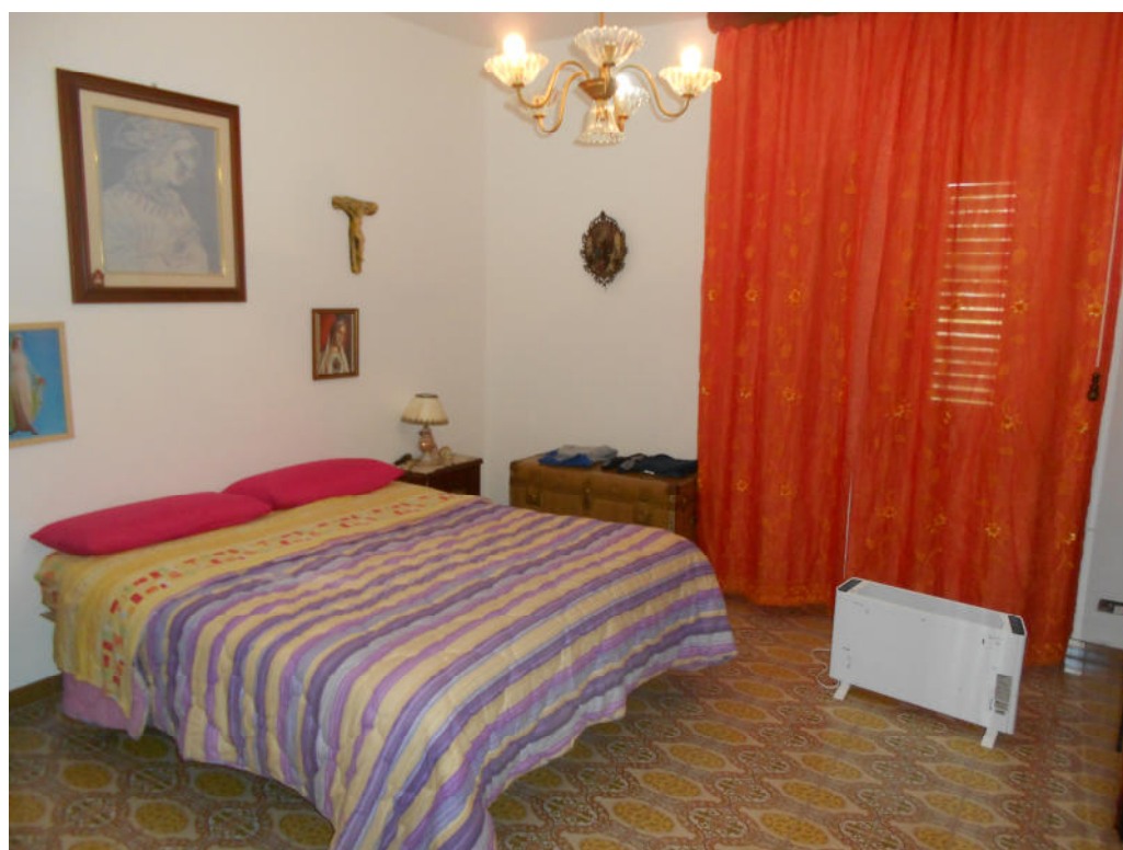
Corpo A - Foto 14