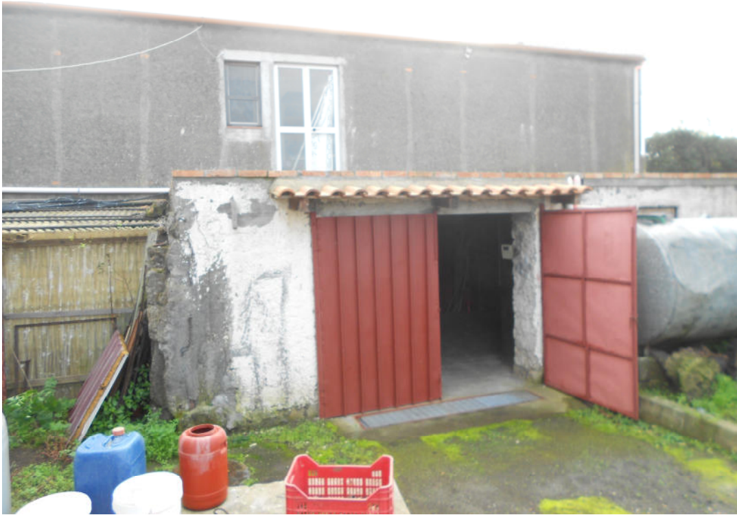
Corpo A - Foto 28