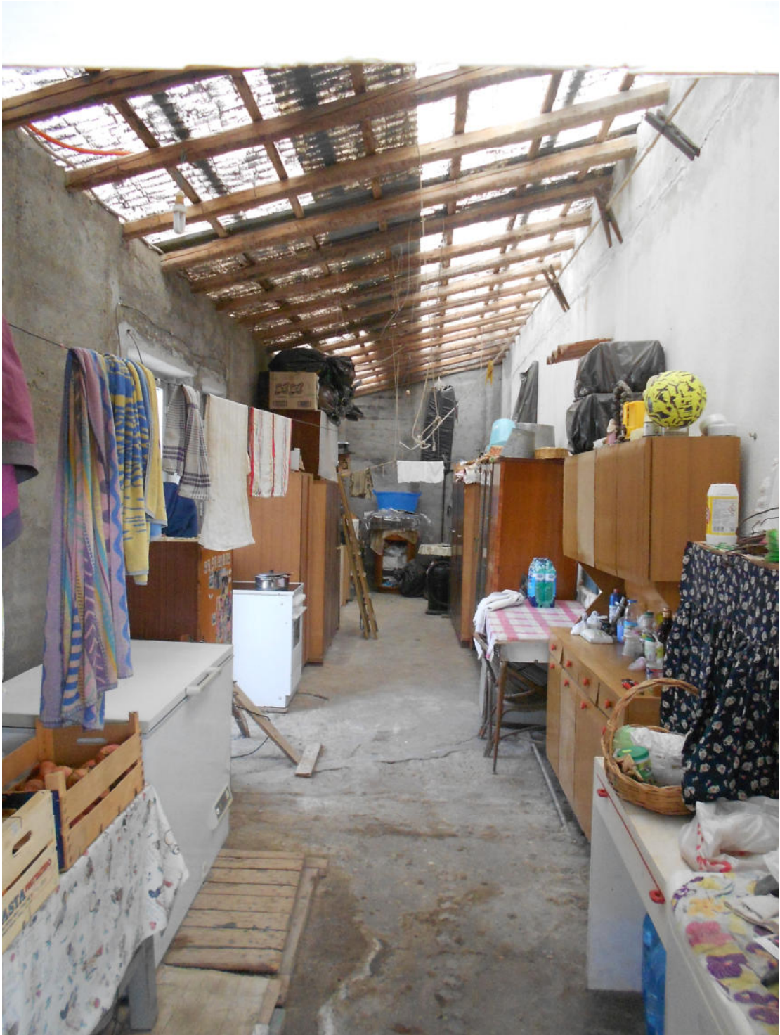
Corpo A - Foto 19