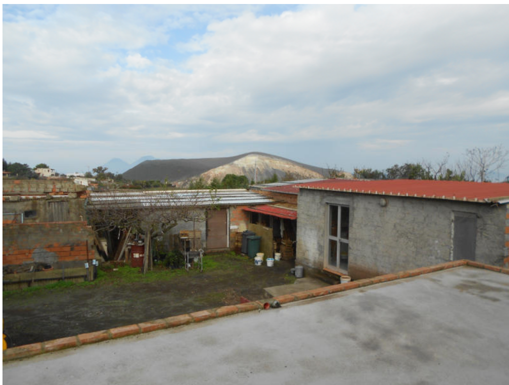
Corpo A - Foto 24