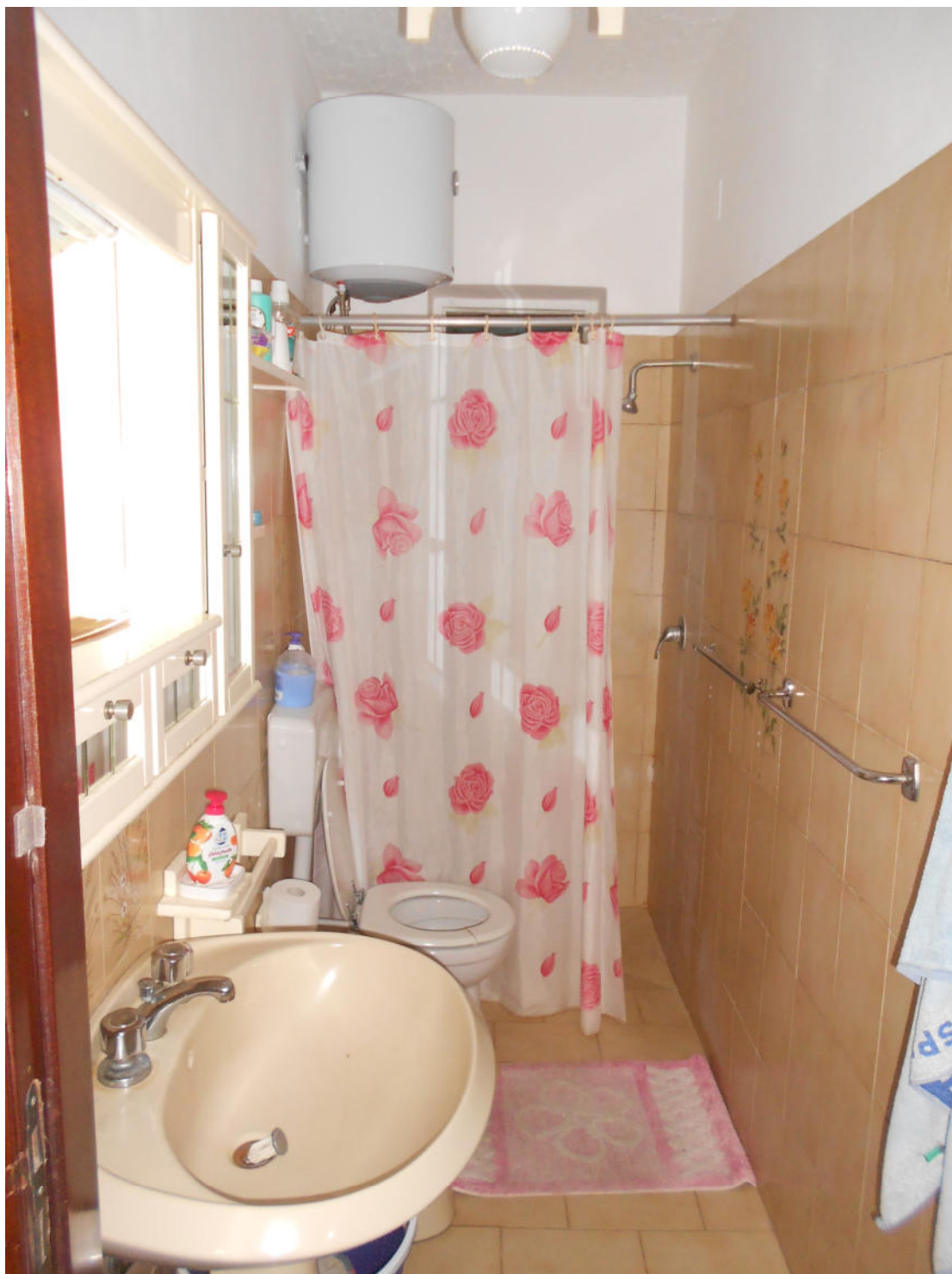
Corpo A - Foto 15