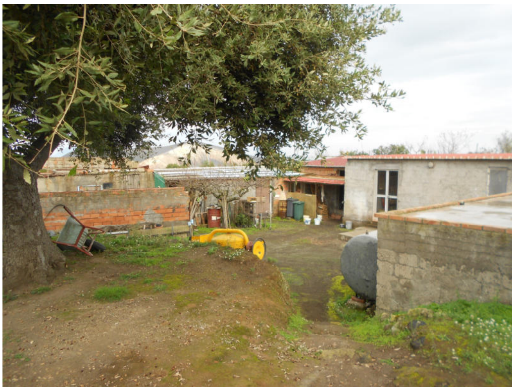
Corpo A - Foto 27