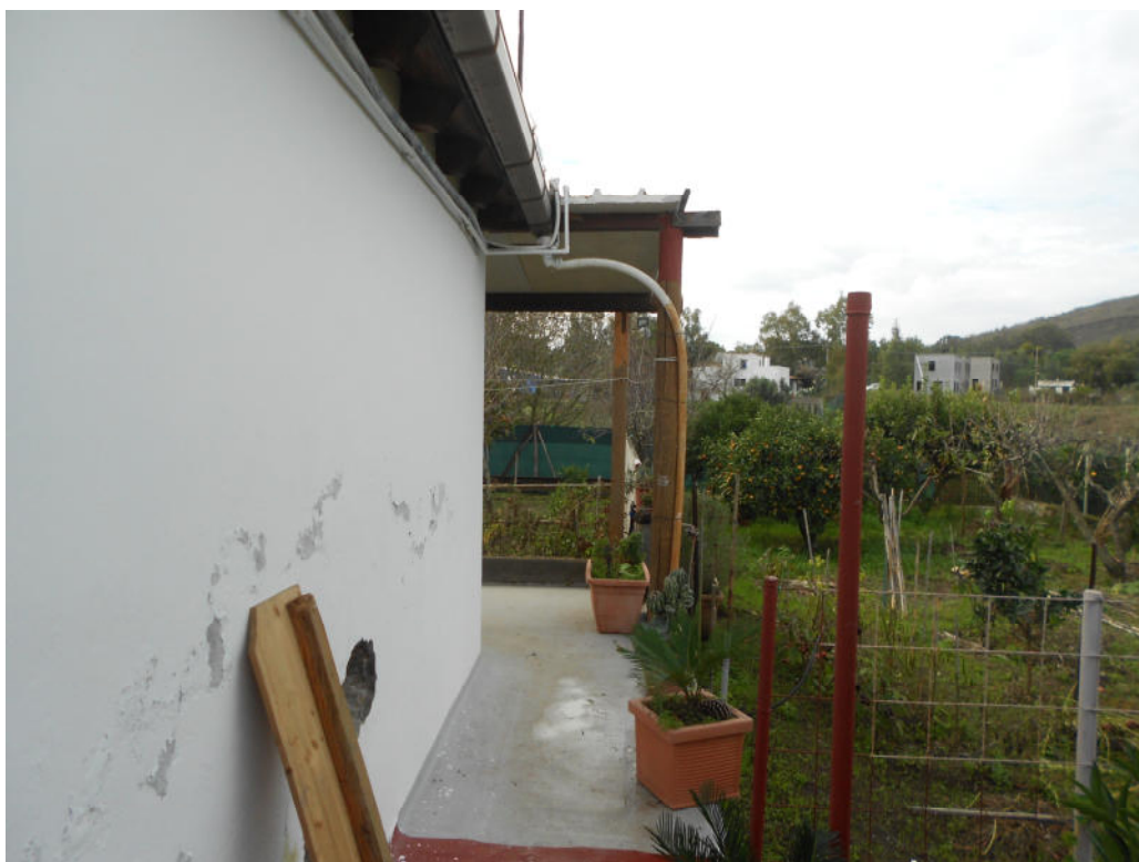
Corpo B - Foto 45