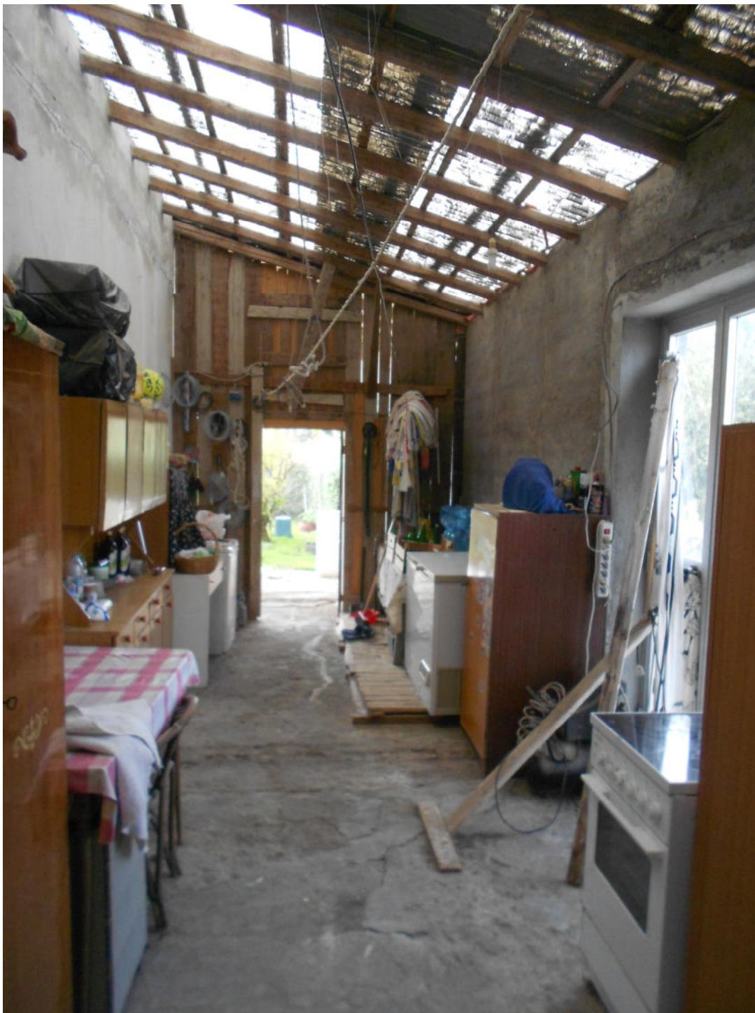
Corpo A - Foto 20