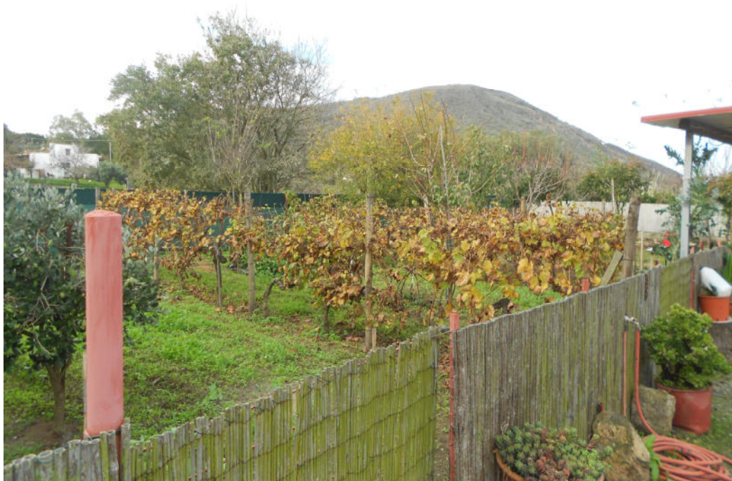
Corpo B - Foto 36