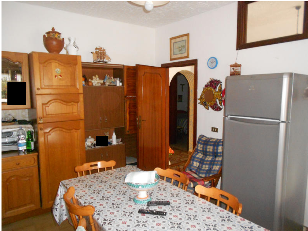
Corpo A - Foto 8