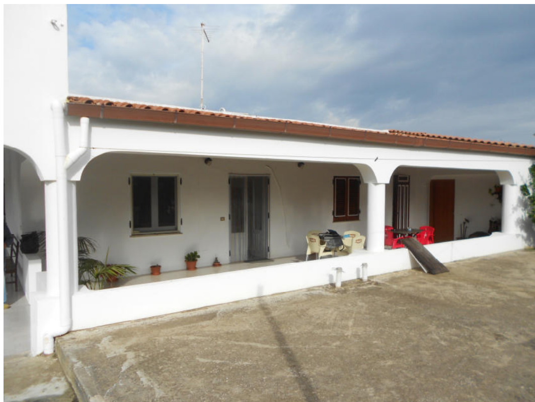
Corpo A - Foto 2