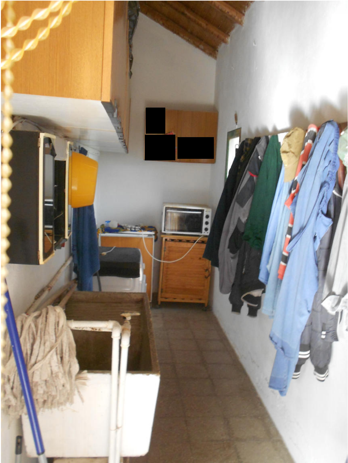
Corpo A - Foto 18