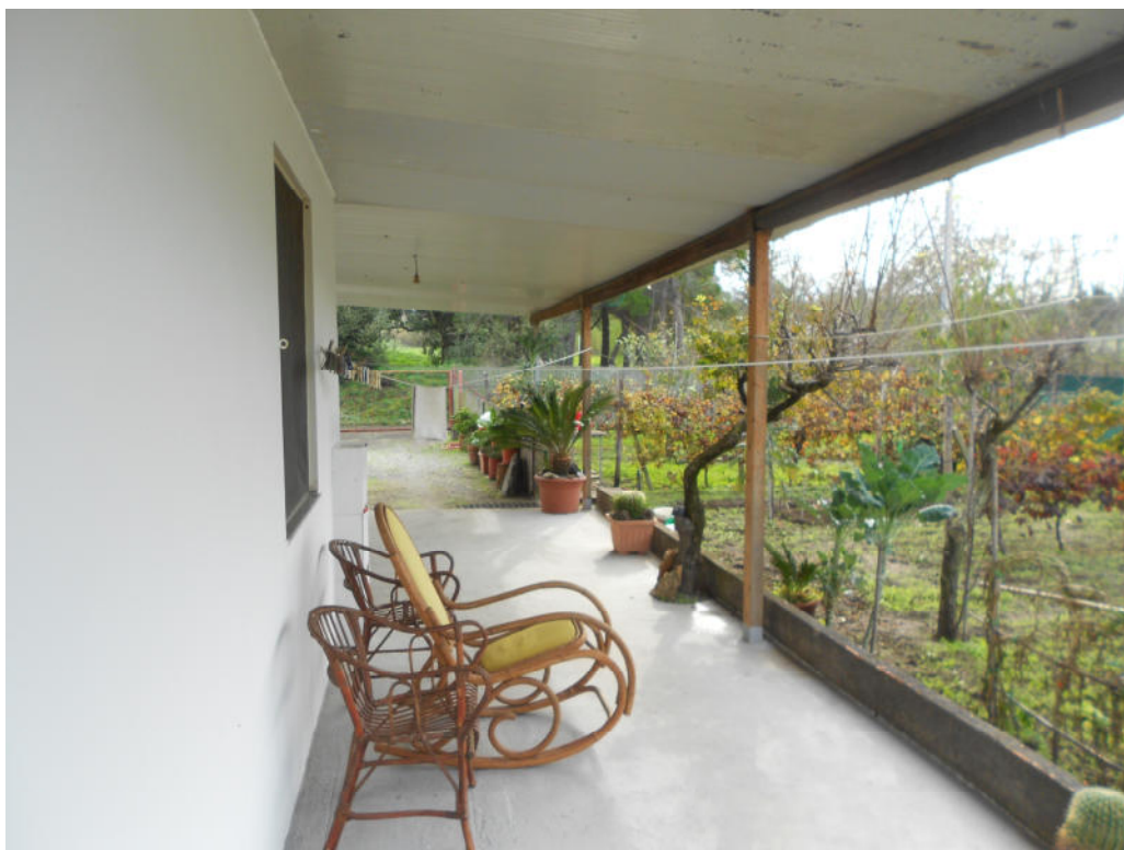
Corpo B - Foto 46