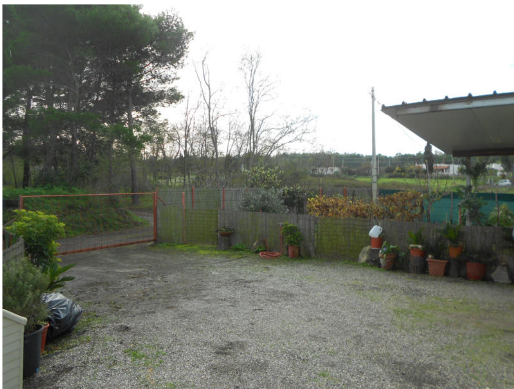
Corpo B - Foto 37