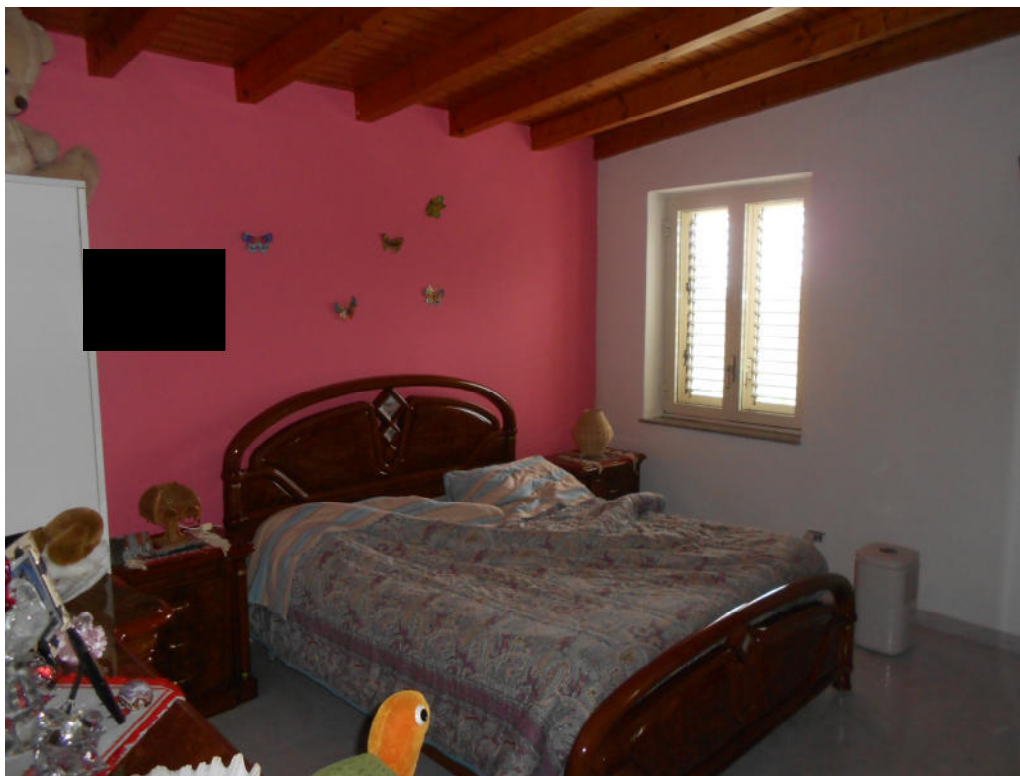
Corpo B - Foto 51