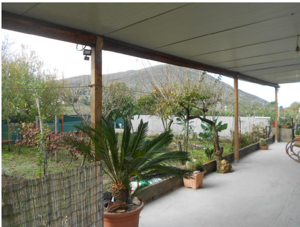
Corpo B - Foto 40