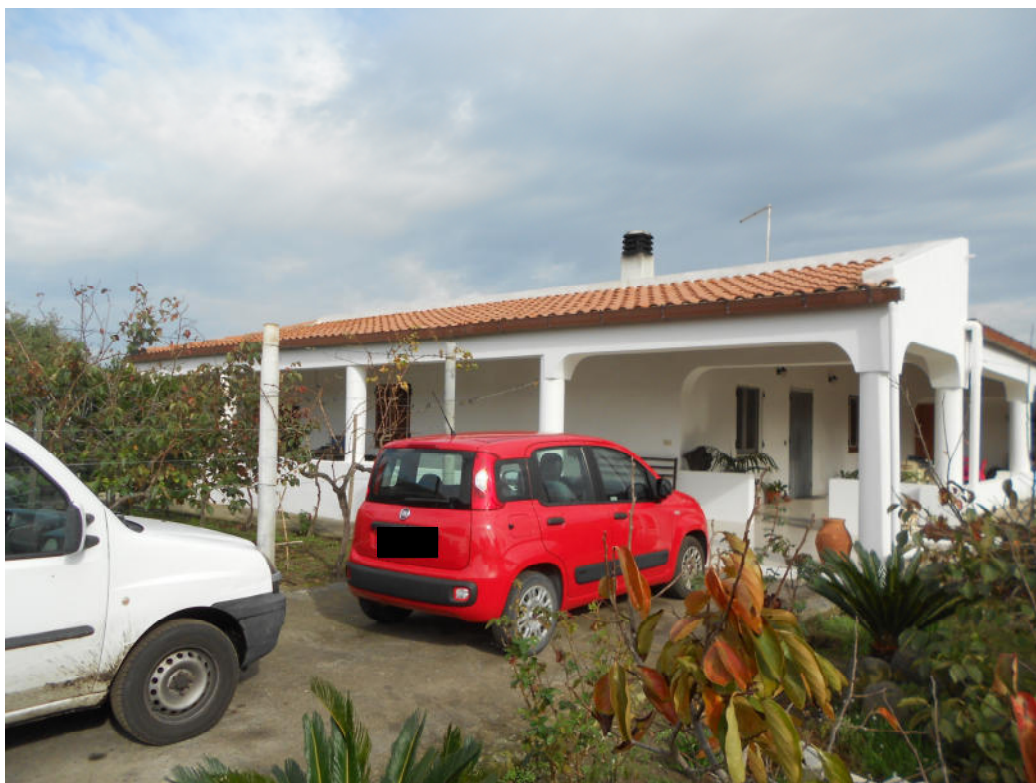
Corpo A - Foto 1