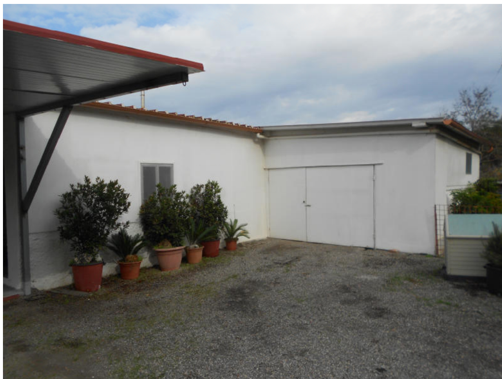
Corpo B - Foto 34