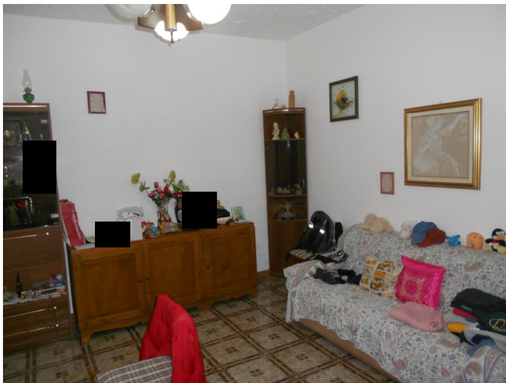
Corpo A - Foto 11