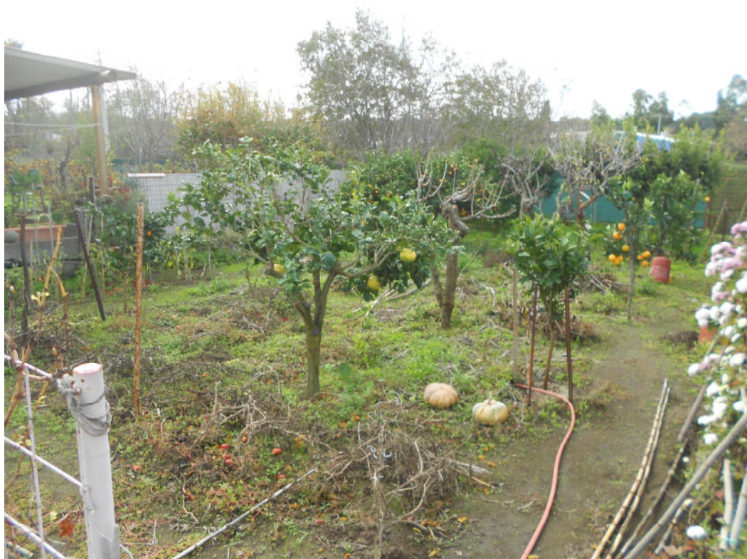
Corpo A - Foto 33