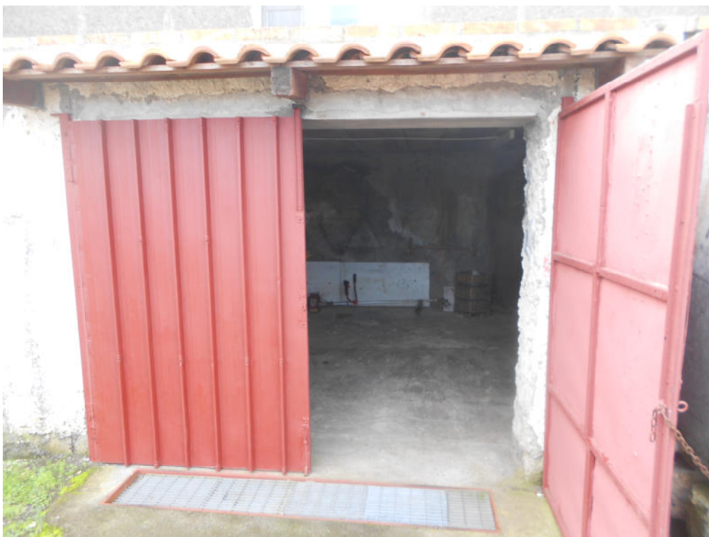
Corpo A - Foto 25