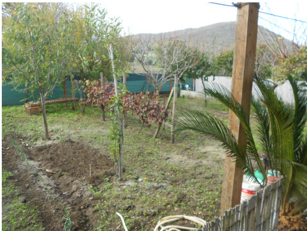
Corpo B - Foto 42