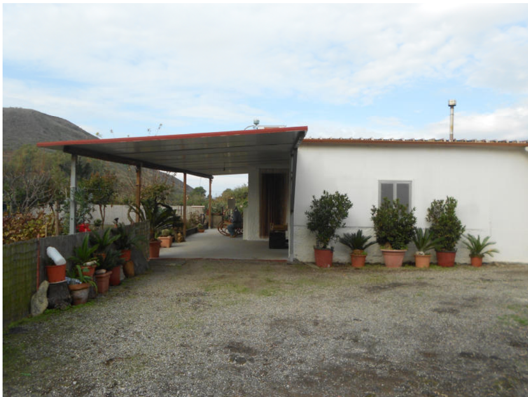
Corpo B - Foto 39