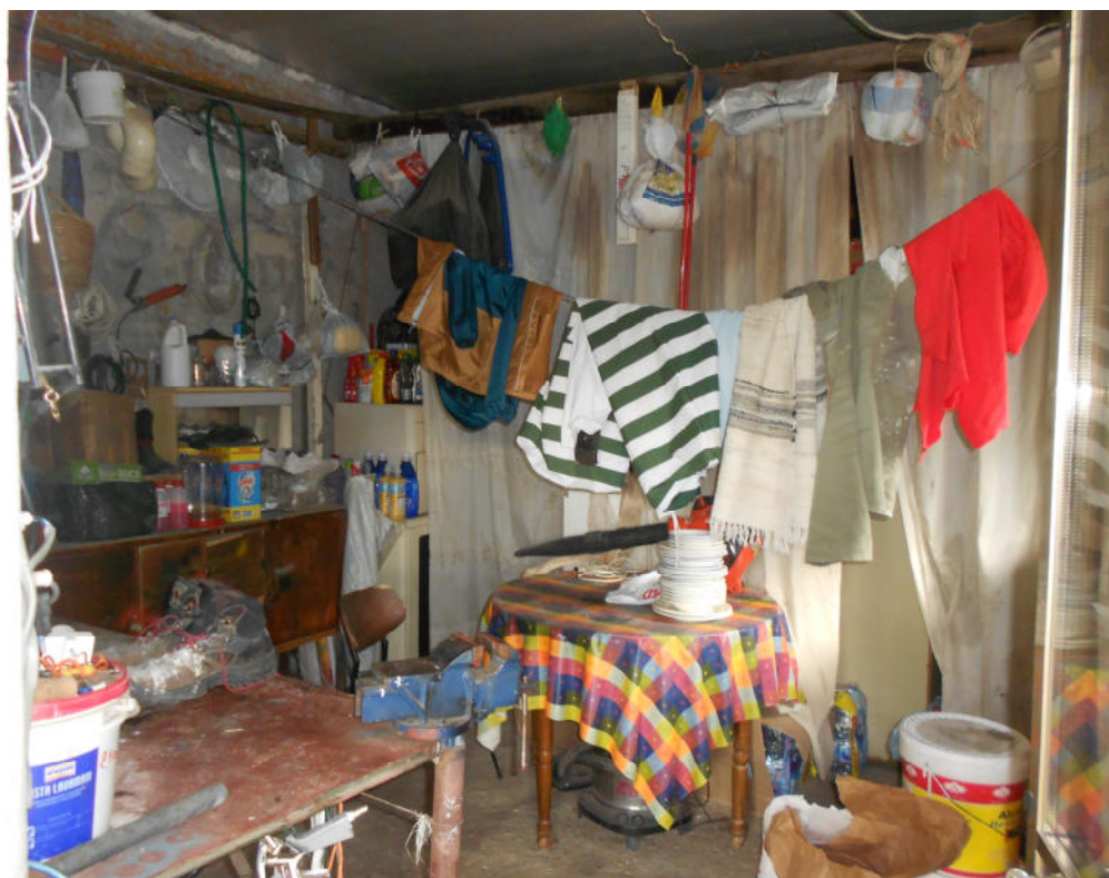
Corpo B - Foto 53