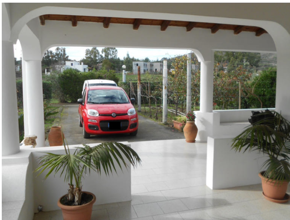
Corpo A - Foto 5