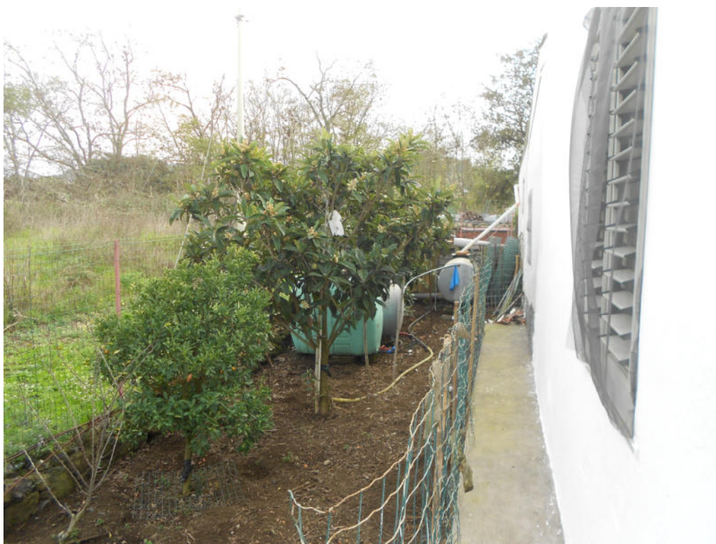
Corpo B - Foto 43