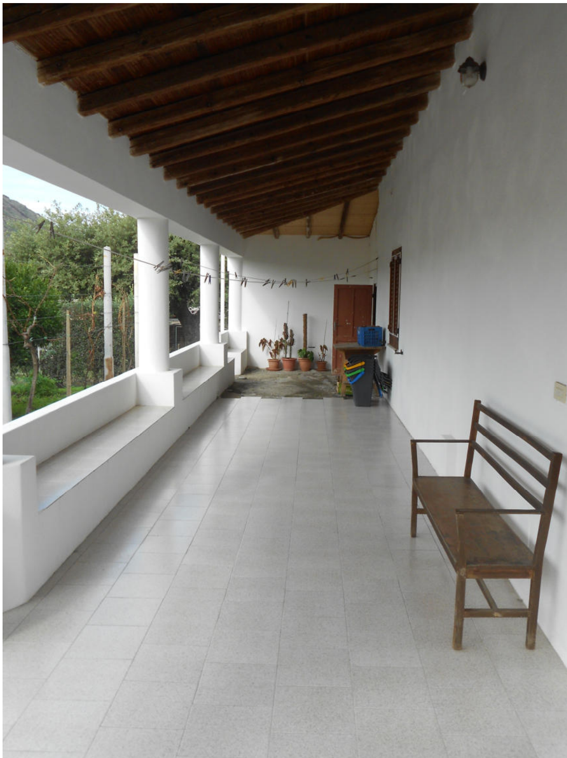
Corpo A - Foto 6