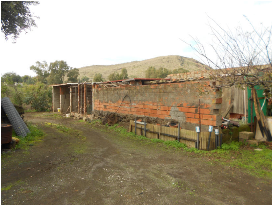
Corpo A - Foto 22