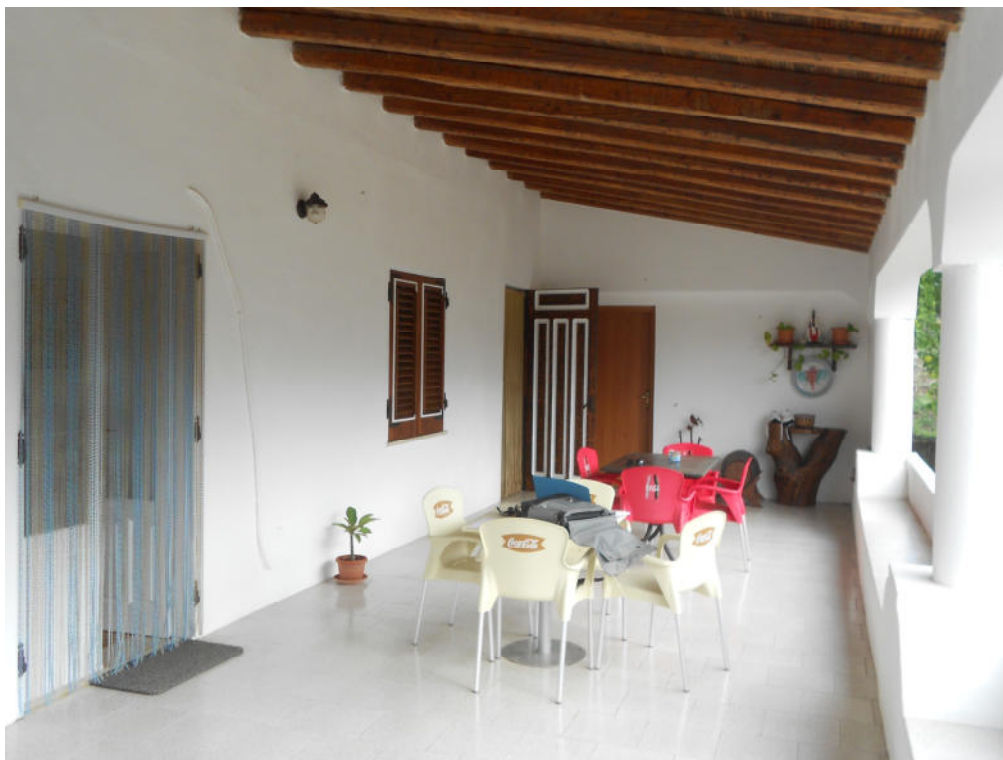
Corpo A - Foto 4